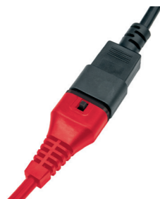
Protection intégrée des câbles