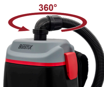
Bras pivotant à 360°, mobilité infinie