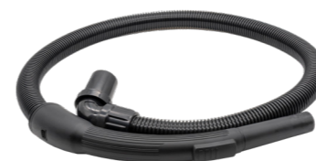
Tuyau d'aspiration, 1,3m N° article 119.124