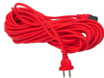
Câbles électriques de 15 m N° article 119.119