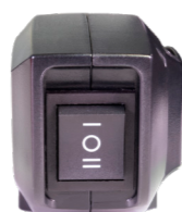
Mode ECO pour la version à batterie