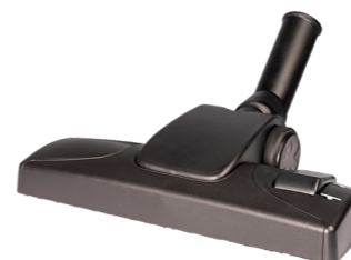
Embout combiné, 280mm N° article 114.114