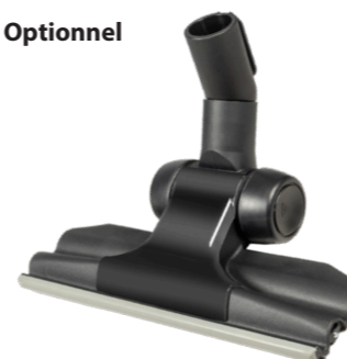
embout combiné, 280 mm N° article 119.126