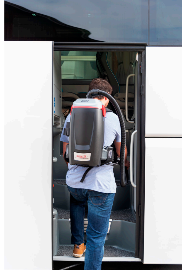
Parfait pour les entrées étroites, les escaliers et les locaux.

Système de transport de haute qualité et confortable pour les deux modèles BoostiX.