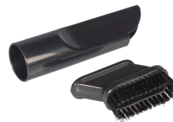
2in1 suceur pour fentes avec brosse N° article 115.127