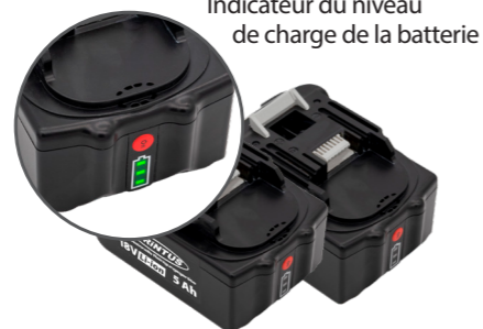
2 x batterie, 18V 5Ah N° article 119.121 (1 x batterie)