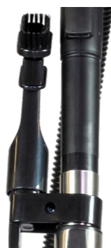
Stockage pratique des accessoires