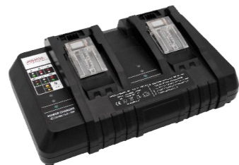
Chargeur, externe N° article 119.120