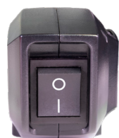
Bouton d'alimentation facilement accessible