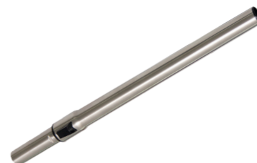
Tube d'aspiration télescopique, inox 0,6 - 1,0 m. N° article 111.133